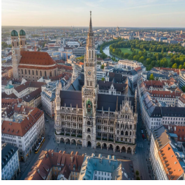
فيونخ - النمانيا