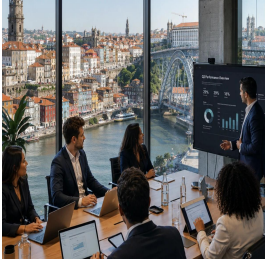
بورنو - البرتغال