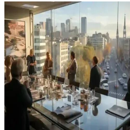
مدريد - إسبانيا