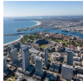
سان دييغو - الولايات المتحدة الأمريكية