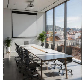
لشبونة - البرتغال