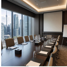
تورنتو - كندا